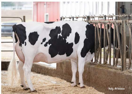
COOKIECUTTER A HOMILY GRANDDAM