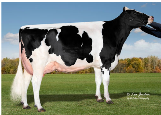
COOKIECUTTER HOPELYNN THIRD DAM